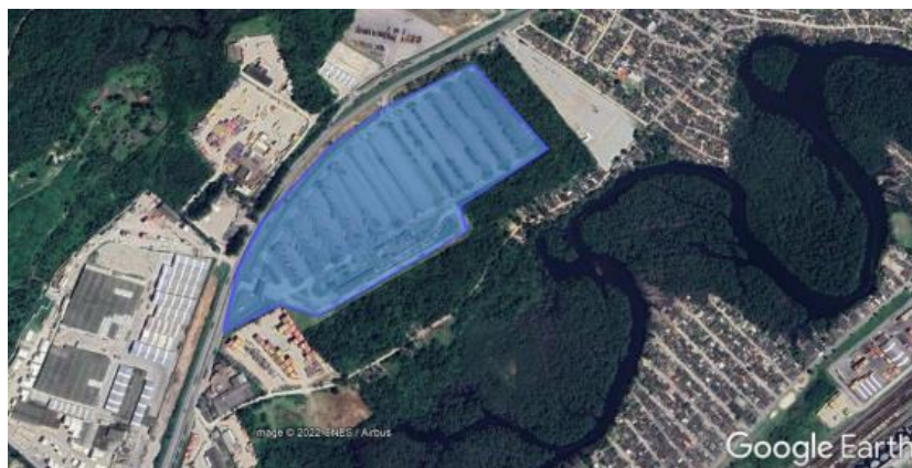
Figura 2 – Pátio de Triagem da APPA Com uma área de aproximadamente 200.000 m 2 em pavimento asfáltico