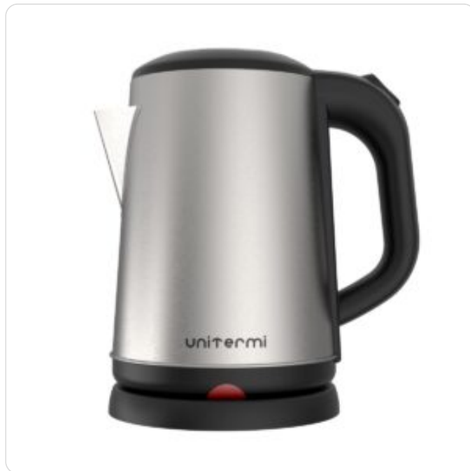
Chaleira Elétrica Saara 1,8 L Inox