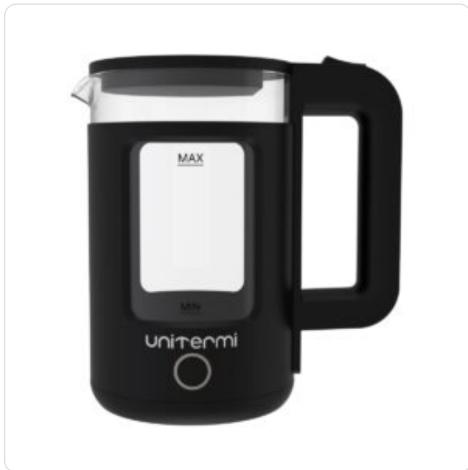
Chaleira Elétrica Mali 1,5 L