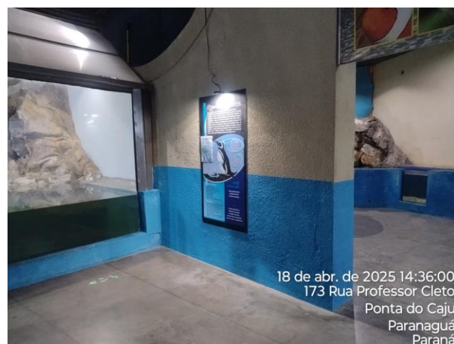
Figura 2. Registros do recinto “Pinguinário” no Aquário de Paranaguá.