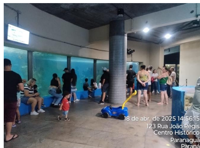
Figura 1. Registros do recinto “Oceano” no Aquário de Paranaguá.