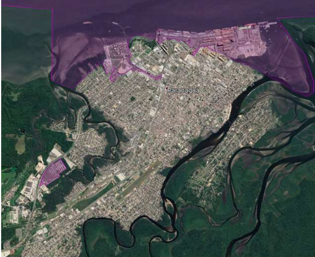
Figura 1 – Área de realização dos serviços em Paranaguá

Independentemente dos locais acima listados os serviços também poderão ser executados em outras áreas de responsabilidade da APPA, desde que solicitados pela Fiscalização-APPA.