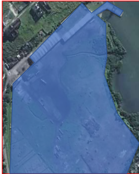
Figura 2 – Porto Barão de Teffé (Antonina)

DIRETORIA DE ENGENHARIA E MANUTENÇÃO Gerência de Manutenção Geral