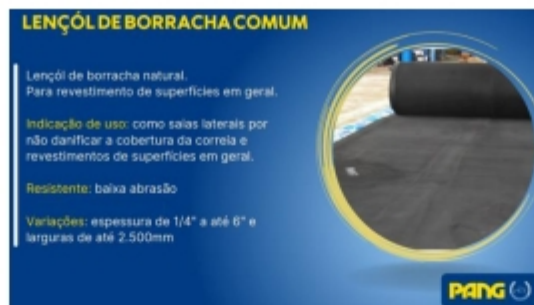
Figura 3 – Tipos de materiais ofertados no catálogo do fabricante

Na página 87 da documentação, há uma tabela de dureza e menção aos compostos do material (Figura 4) indicando a existência materiais com 40 até 90 Shore A de dureza, o que reforça que a empresa consegue atender a dureza de 60 \pm 5 Shore A estabelecida no termo de referência.