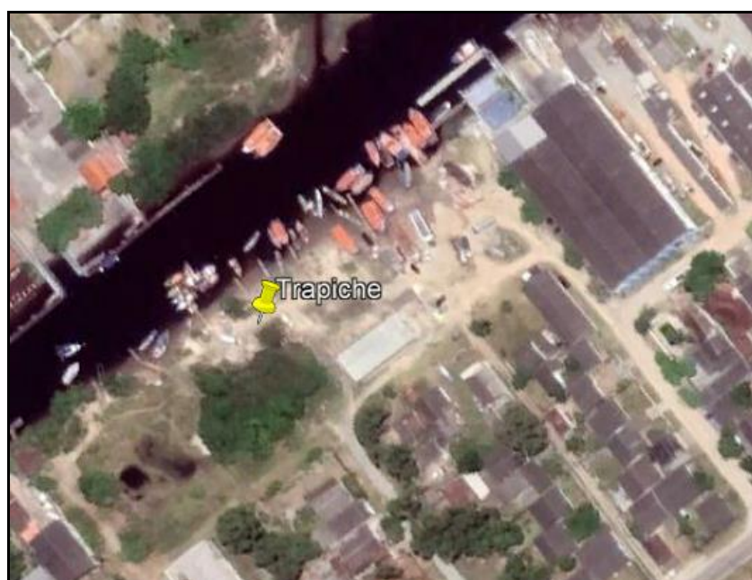
Figura 1 – Localização do novo trapiche do Mercado do Peixe

O novo trapiche será localizado nas proximidades do Mercado do Peixe, em Pontal do Paraná. As coordenadas do ponto central do enraizamento do trapiche na costa são 25°34'7.07"S e 48°21'36.14"O: