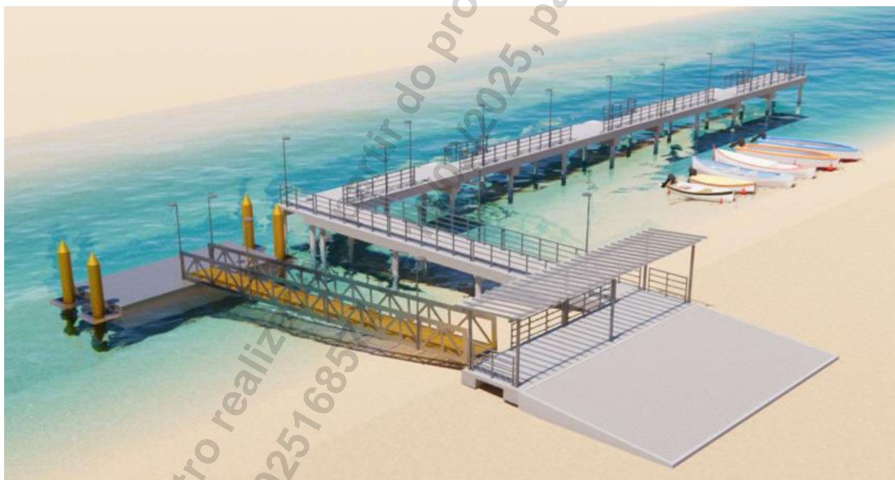
Imagem 1 - Imagem 3D representando o projeto básico final elaborado pela contratada (sem gabião).