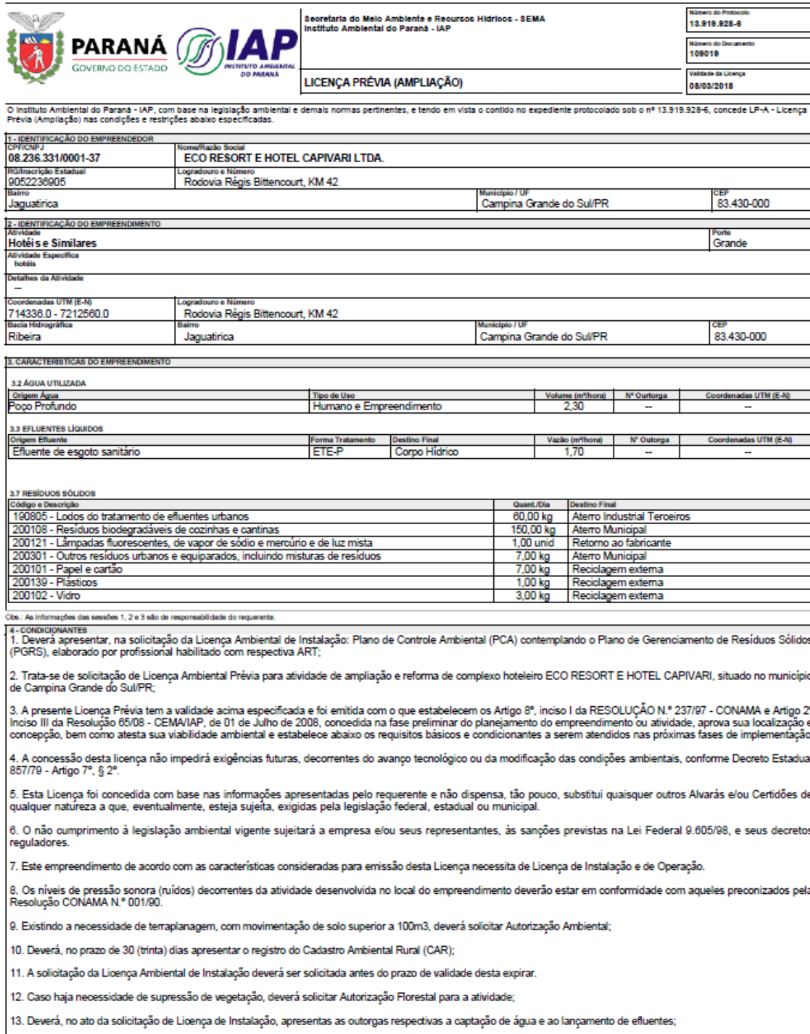
Figura 2 – Licença Prévia emitida pelo IAP para o Eco Resort E Hotel Capivari Ltda.