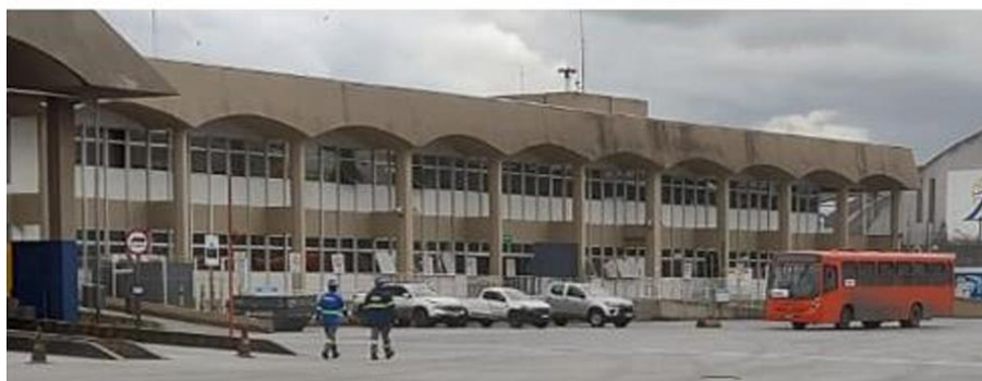
Figura 2: Vista da Edificação.

Avenida Ayrton Senna da Silva, 161 | D. Pedro II | Paranaguá/PR | CEP 83203-800 | 41 3420.1143