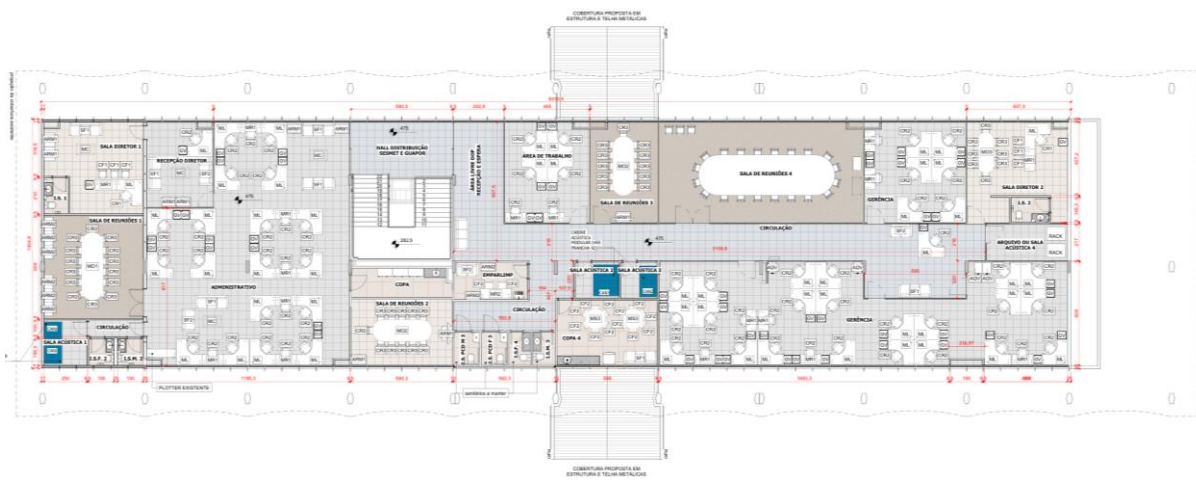
Figura 4: Novo layout pavimento superior.

As informações contidas nos documentos do Projeto Básico de Engenharia ( Anexo III ) devem ser consideradas para o levantamento e especificação do escopo para proposta técnica e comercial. Qualquer dúvida em relação ao escopo, premissa técnica ou desvio que a CONTRATADA julgue necessário esclarecer deverá ser realizada durante a etapa de esclarecimentos técnicos.