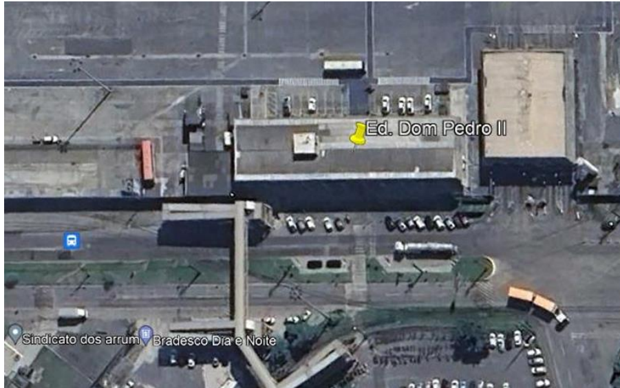
Figura 1: Localização do Ed. Dom Pedro II.